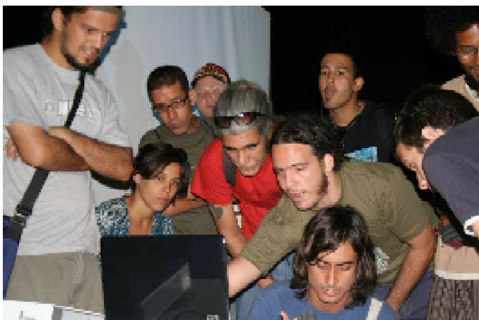
Algunos alumnos que asistieron. Arriba, cartel ABC VJ